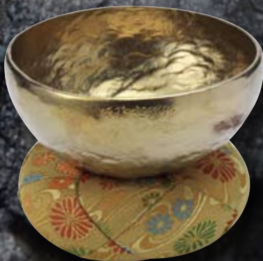
Coupelle pour rite bouddhiste en titane

Développement en collaboration avec la marque Seiko d'un gong pour le chronomètre « Minute Repeater ».