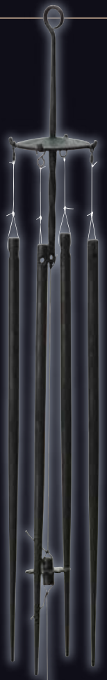
Clochettes à vent