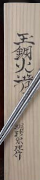
Tamahagane (baguettes en métal noir carillonnantes avec le vent)